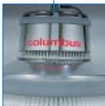
Qualité durable : acier inox