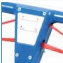
Timon de sécurité

Rapport qualité/prix _____ _____ très intéressant