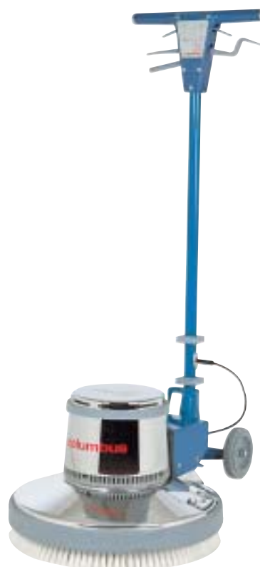
E 500 S E 500 E E 500 E PACK

La gamme des monobrosses basse vitesse permet d'effectuer tous les travaux de lavage, décapage, ponçage dans les meilleures conditions. En acier inoxydable, elles sont très robustes et d'une efficacité accrue grâce à leur pression au sol élevée.