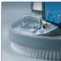
Faciles à transporter : 2 poignées intégrées