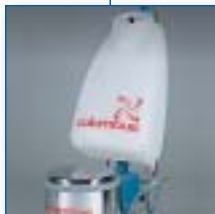
Réservoir de grande capacité : 12 litres