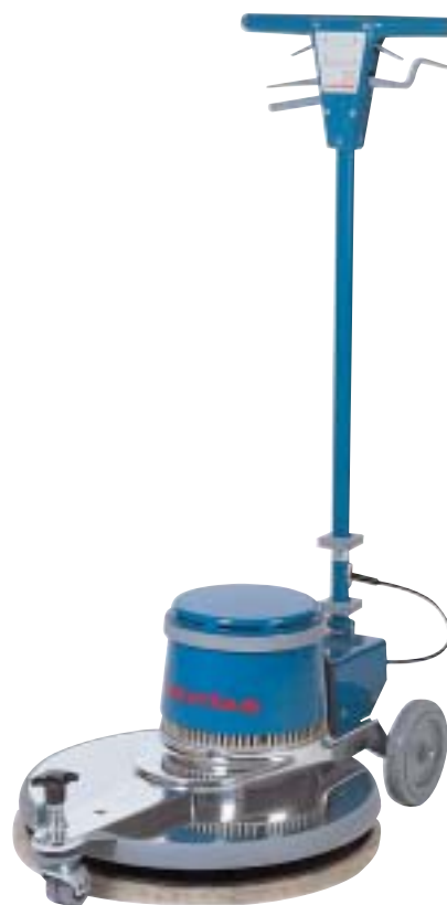
Polisseuses très haute vitesse : HS 1001 HS 1601

Les monobrosses haute vitesse pour le lustrage et la spray. Les polisseuses très haute vitesse pour une parfaite brillance des sols protégés.