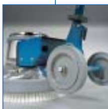
Faciles à déplacer : 2 roues escamotables