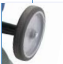
2 roues grand diamètre