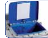
Couvercle avec porte protocole