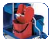
2 Seaux + 1 presse