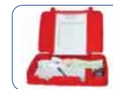
Couvercle avec cassette de rangement et porte protocole